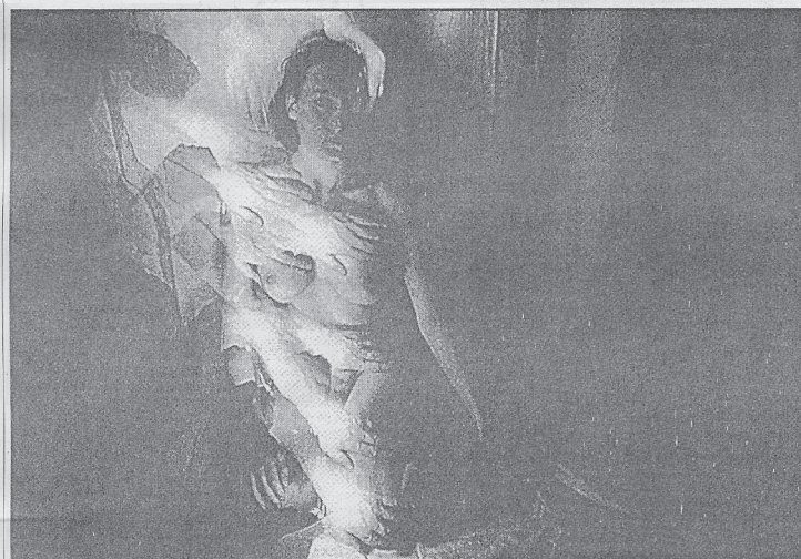
Desnuda con manos. Fotos: Evgene Bavčar. TOMADAS DE: LUNA CORNEA, NÚMERO 17, ENERO-ABRIL, MÉXICO, 1999.

USTED ASUME PERTENECER A UNA GENERACIÓN DESGRACIADA, RESULTADO DE LA SEGUNDA GUERRA