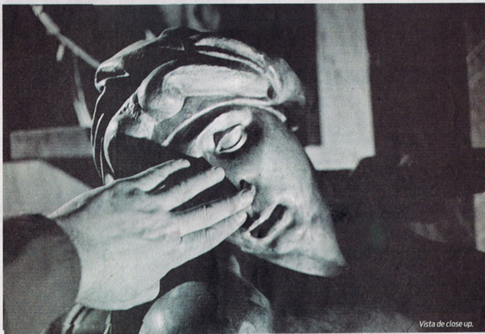
Vista de close up.