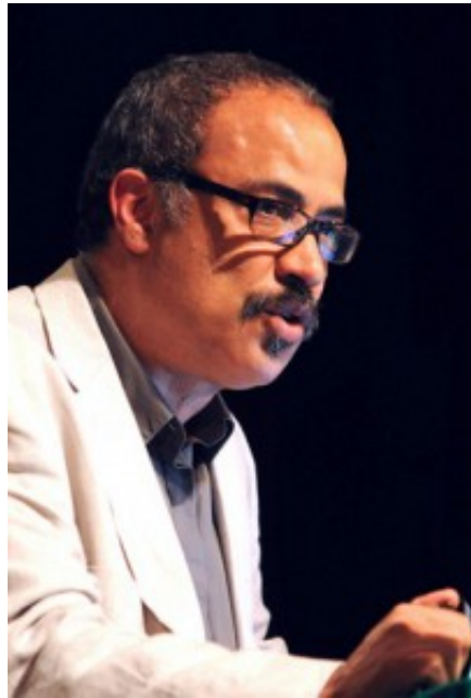
Coloquio Internacional Las tres eras de la imagen