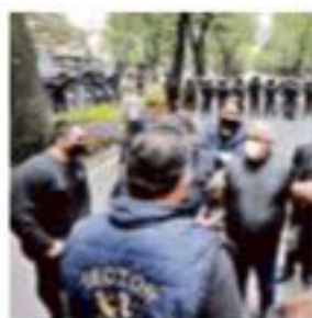
Técnicos del INBA protestaron por el cierre del Teatro Jiménez Rueda.