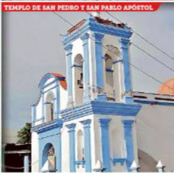
El sismo del martes agravó el panorama; 62 inmuebles patrimoniales resultaron dañados en Oaxaca, el Estado más afectado.