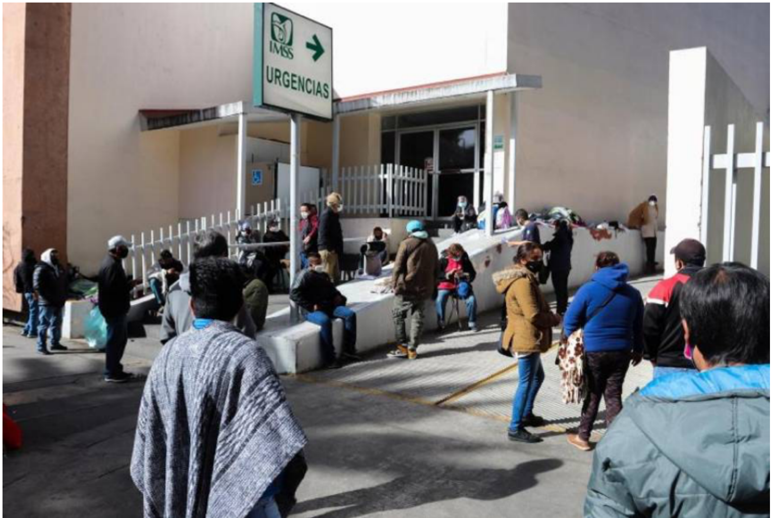
Familiares de pacientes contagiados por la covid-19, esperan informes en las afueras de un Hospital del Instituto Mexicano del Seguro Social (IMSS), en Ciudad de México.