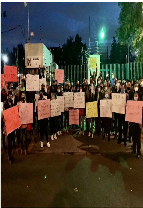
PRIÍSTAS BLOQUEAN SEDE NACIONAL; DEMANDAN RENUNCIA DE 'ALITO'