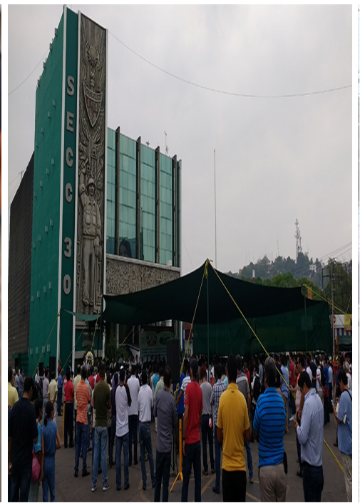
EXIGEN APOYO SINDICAL POR ABUSOS EN PEMEX